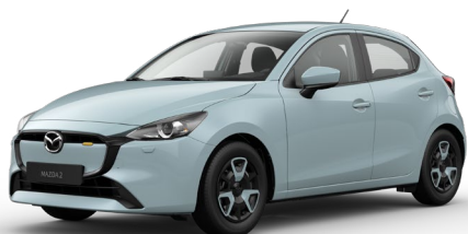
AIR STREAM BLUE (52L) 4)