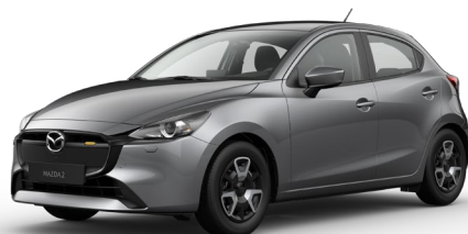
MACHINE GREY (46G) 5)