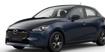
DEEP CRYSTAL BLUE (42M) 4)