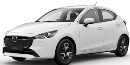
ARCTIC WHITE (A4D)