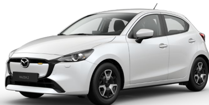
SNOWFLAKE WHITE (25D) 4)