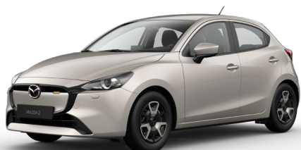
PLATINUM QUARTZ (47S) 4)