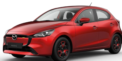
SOUL RED CRYSTAL (46V) 5)