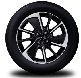
16-Zoll-Leichtmetallfelge HOMURA AKA