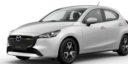
CERAMIC WHITE (47A) 4)