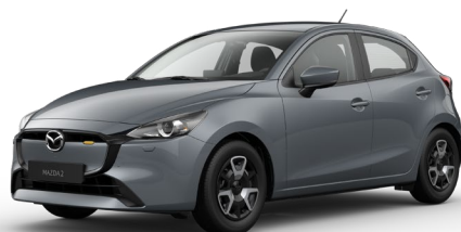
POLYMETAL GREY (47C) 5)