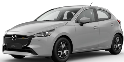
AERO GREY (52C) 4)