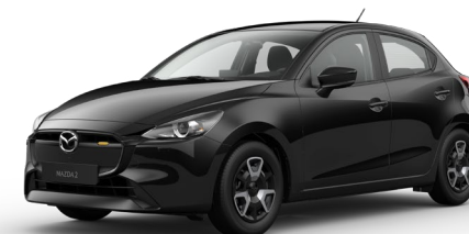
JET BLACK (41W) 4)