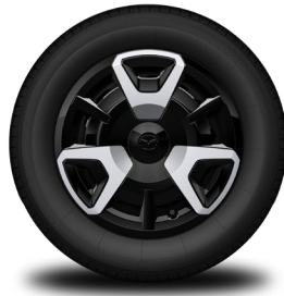
15-Zoll-Radzierblende CENTER-LINE 3)