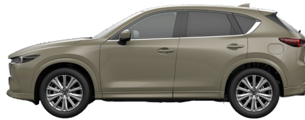
ZIRCON SAND (48T) 10)