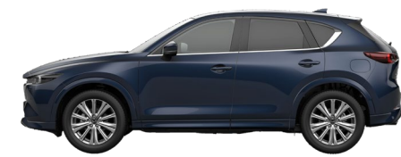
DEEP CRYSTAL BLUE (42M) 10)