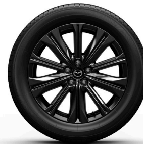
19-Zoll-Felge Schwarz: Homura