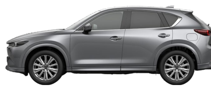
MACHINE GREY (46G) 11)