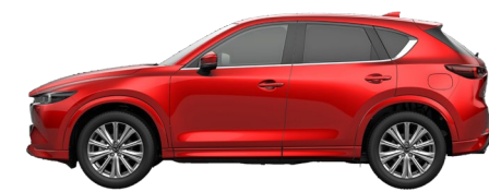
SOUL RED CRYSTAL (46V) 11)