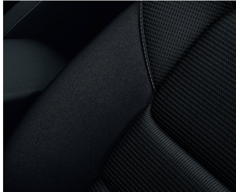
Stoff mit Streifenmuster