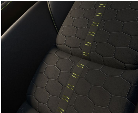
Sitze mit Grand Luxe®/Kunstlederkombination mit Grüngelb-Akzenten (Newground)