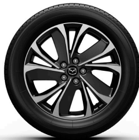
19-Zoll-Felge: Ad'vantage, Newground, Exclusive-Line