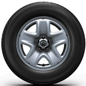
17-Zoll-Stahlfelge mit Radzierblende