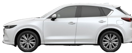
RHODIUM WHITE (51K) 11)