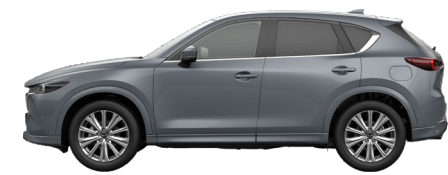
POLYMETAL GREY (47C) 11)