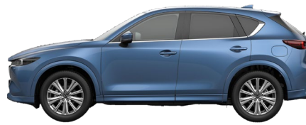
ETERNAL BLUE (45B) 10)