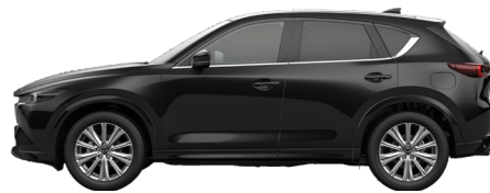
JET BLACK (41W) 10)