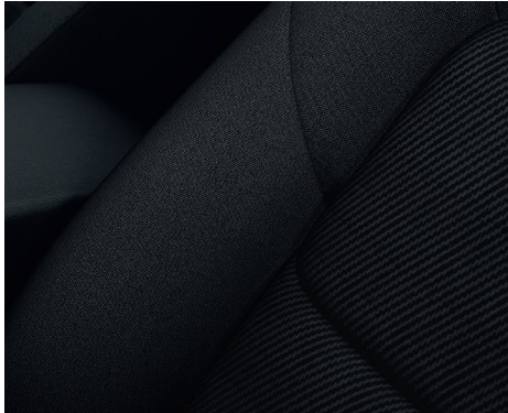
Stoff mit Wellenmuster