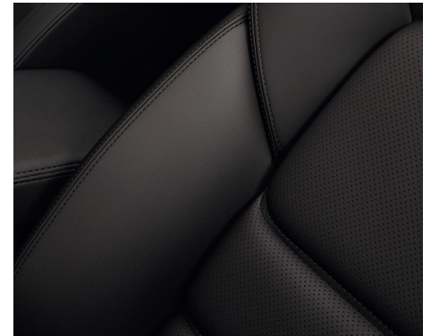
Nappaleder* Braun (Takumi)