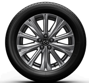
19-Zoll-Felge Silber: Takumi