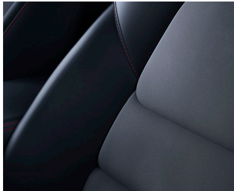
Sitze mit Grand Luxe®/Kunstlederkombination mit roten Nähten (Homura)