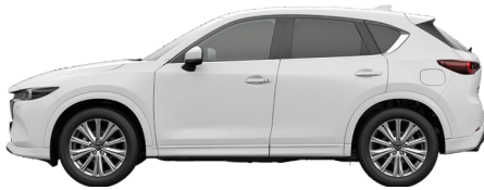
ARCTIC WHITE (A4D)